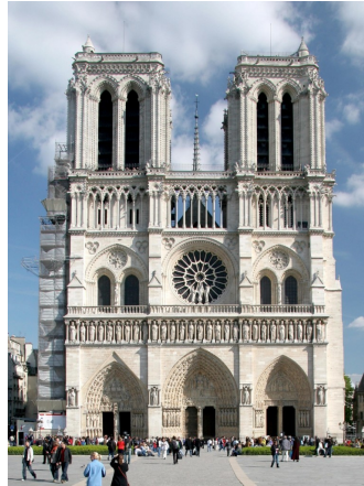
Catedral de Notre Dame