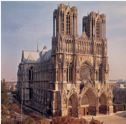
Catedral de Reims

El paralelo del gótico es la polifonía, música a varias voces que ascienden y descienden dinámicamente, elevándose hacia las alturas.